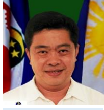
안와 말랑 DTI-ARMM, 필리핀