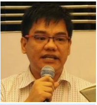
고머 파동 PhilSEN, 필리핀