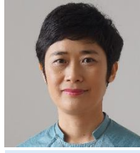
팜 키우 오안 CSIP, 베트남