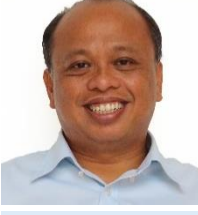
알피 오트만 raiSE, 싱가포르