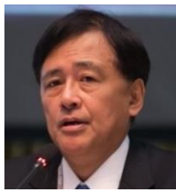
노부토 호사카 세타가야시, 일본