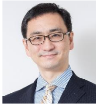
마사타카우오 NAB Japan, 일본