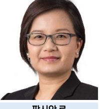
팻시안 로 AVPN, 싱가포르